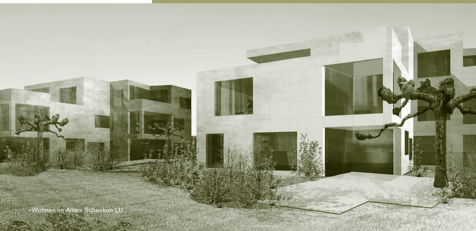
«Wohnen im Alter» Schenkon LU