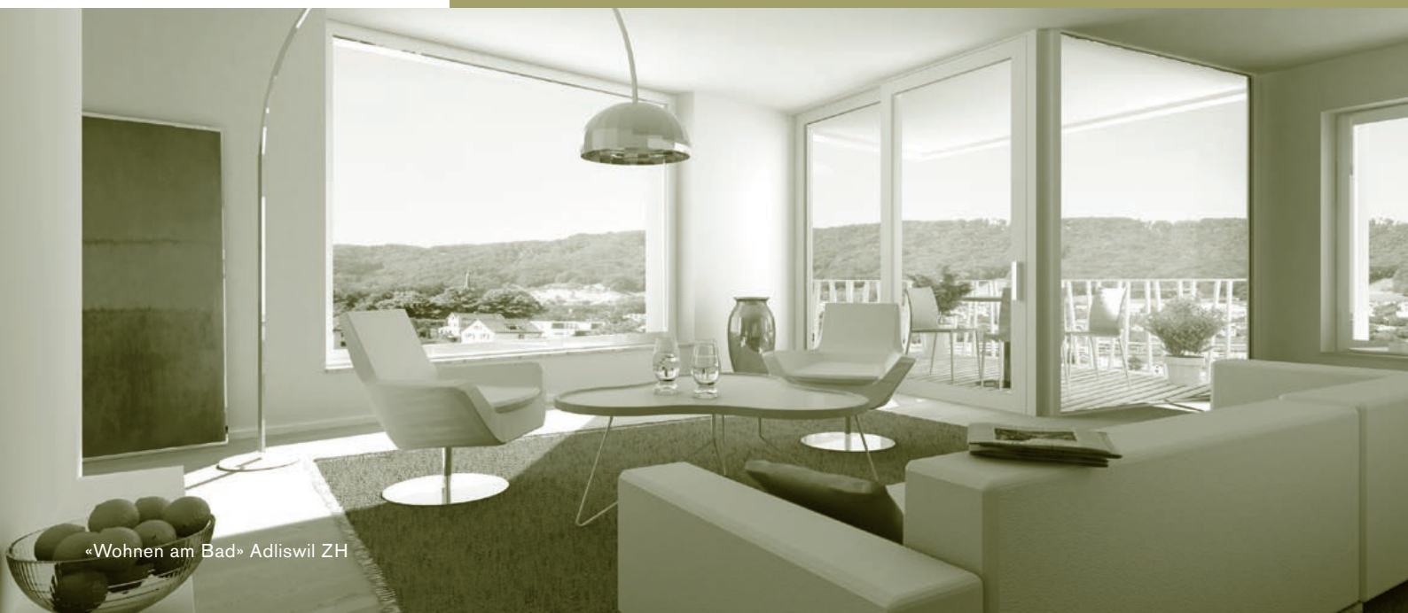
«Wohnen am Bad» Adliswil ZH